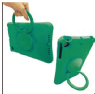
回転式ハンドル+スタンド